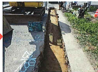
④ 山砂による埋戻し