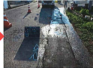
⑧ 仮復旧の施工 (舗装復旧までの状態です)